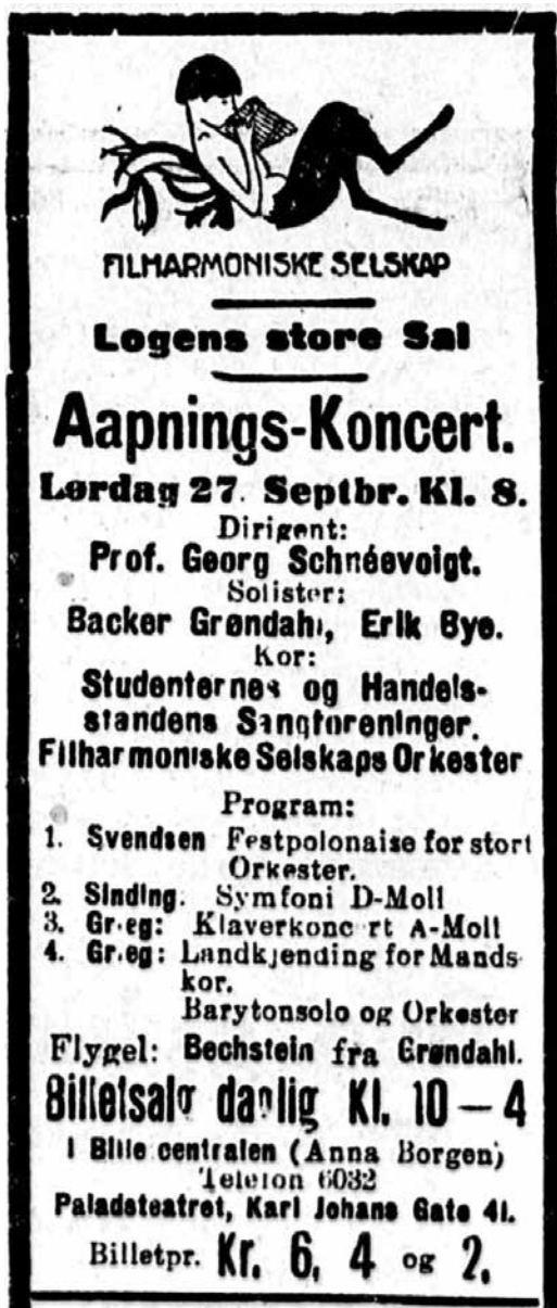
Ilustracja 2. Anons pierwszego koncertu orkiestry filharmonicznej w Kristianii, „Aftenposten” 24.09.1919, s. 4