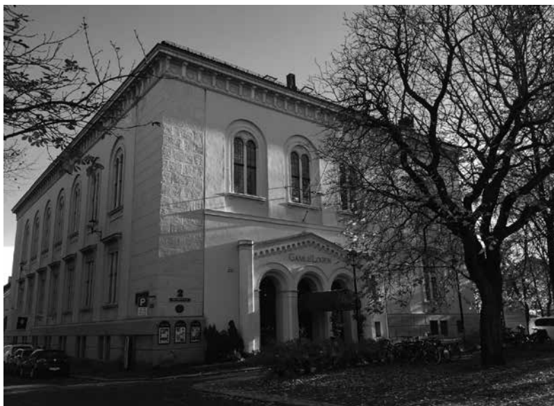
Ilustracja 1. Stara Loža w Kristianii