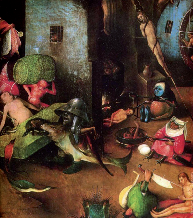
Ilustracja 1. Hieronim Bosch, Sąd ostateczny , fragment; Akademie der bildenden Künste, Wien

rzeczywistości widzialnej. Jakkolwiek obrazy te są atrakcyjne i ciekawe pod względem symbolicznym czy ekspresywnym, to w tym przypadku sferę tę bierzemy w nawias, gdyż analogia stałaby się zbyt skomplikowana. Chodzi zatem wyłącznie o widzialne obiekty, które postrzegamy zmysłem wzroku i które są przedstawione na obrazach.